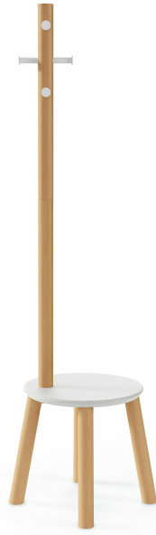
2-In-1 coatrack and stool