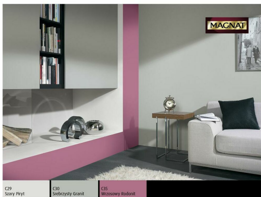
C29 Szary Piłyt