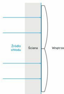
Estetyczna ochrona zimnej ściany

Dzięki prostej, ale bardzo solidnej konstrukcji paneli zablokowany jest przepływ zimnego powietrza do wnętrza. Płyty MDF, odpowiedniej grubości i gęstości gąbka oraz wysokiej jakości tkaniny gwarantują doskonały efekt izolacyjny. Badania potwierdzają – panele mollis® tłumią ponad 70% hałasu i szumu w pomieszczeniach, likwidują pogłos i sprawiają, że wewnątrz staje się wyciszone i niezwykle przytulne.