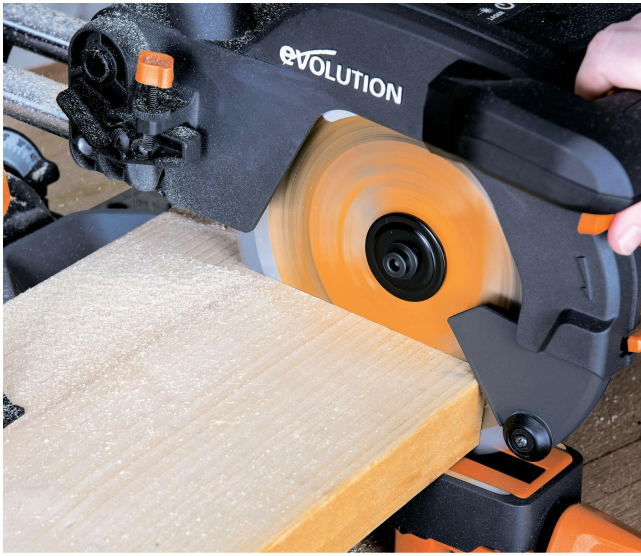
ACCURATE CUTTING MAX. CROSS CUT 300mm x 65mm