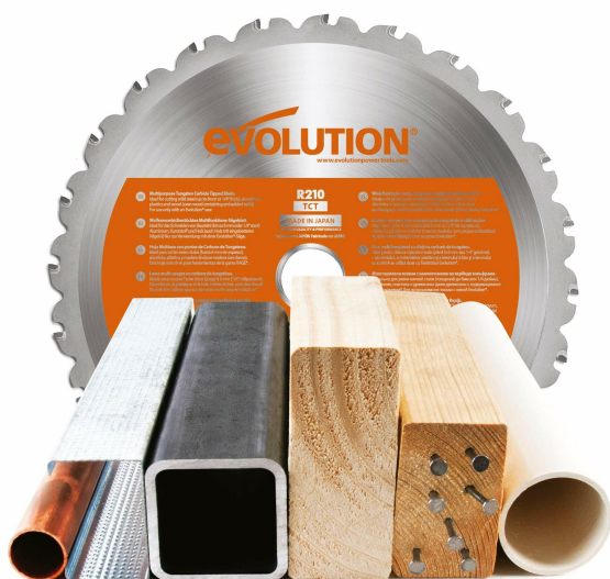
210MM TCT MULTI-MATERIAL BLADE BLADE INCLUDED