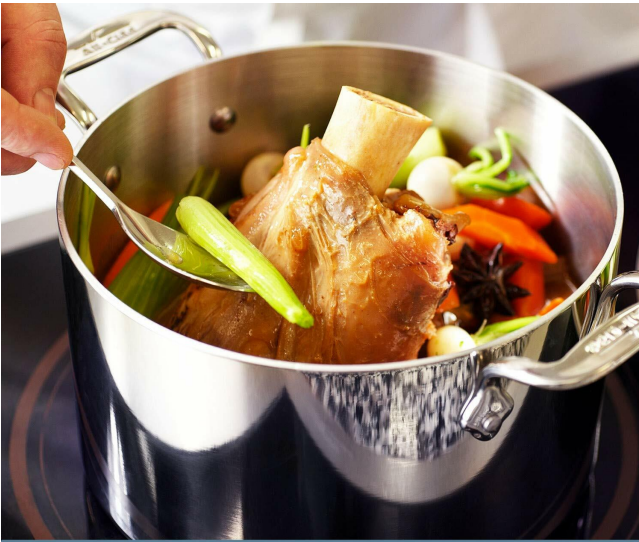
Classic straight edge sides