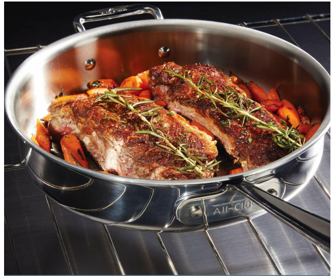
Oven & broiler safe to 600° F